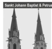
Sankt Johann Baptist & Petrus